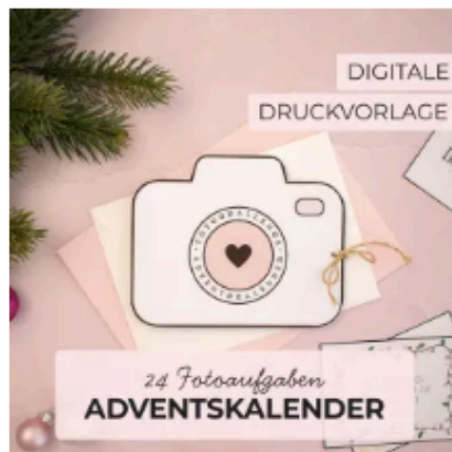
Fotoaufgaben-Adventskalender zum Ausdrucken – 24 kreative Fotoideen