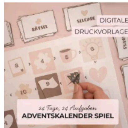
Spielerischer Adventskalender zum Ausdrucken – 24 Tage, 24 Aufgaben